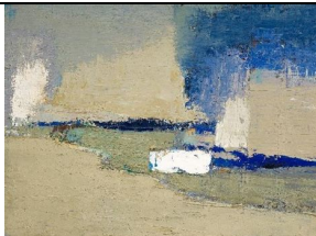
Nicolas de STAËL, Ménérbes, 1954, huile sur toile, 60 x 81, musée Fabre, Montpellier.

Quelques éléments de réflexion : On peut imaginer l'espace hors champ, à l'avant du tableau, au milieu du chemin. C'est l'endroit où se confondent les points de vues du peintre et celui du spectateur. Le chemin représenté, les couleurs, les techniques appliquées par le peintre font cheminer notre regard dans l'espace pictural, jusqu'à l'horizon.