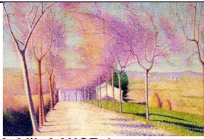
Achille LAUGE, La route au lieu-dit « L'Hort », vers 1896-1898, huile sur toile, 94,5 x 115, musée Fabre, Montpellier.

Schéma de la règle des tiers : Ce schéma peut permettre aux élèves de réaliser facilement un croquis du tableau en tenant compte du format, du cadre (bord de la toile) et de la composition.