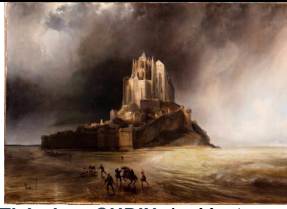
Théodore GUDIN, Le Mont-Saint-Michel sous l'orage, 1830, huile sur toile, 97 x 138, musée Fabre, Montpellier.

T. GUDIN (1802-1880) est un des deux premiers peintres de la Marine, statut officiel au sein de la Marine nationale. Sa peinture est fortement influencée par le Romantisme.